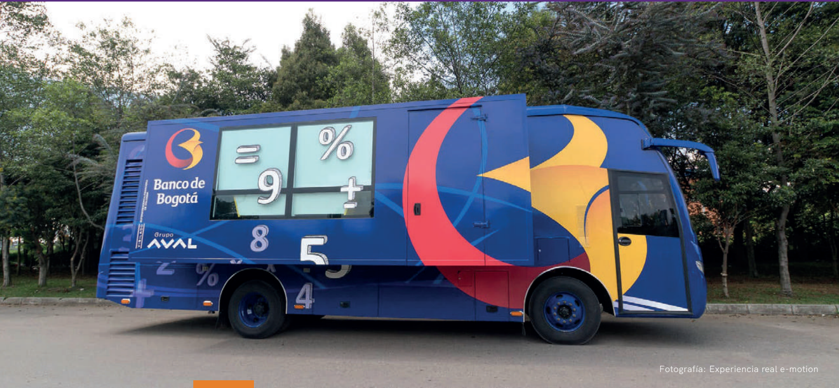
Fotografía: Experiencia real e-motion