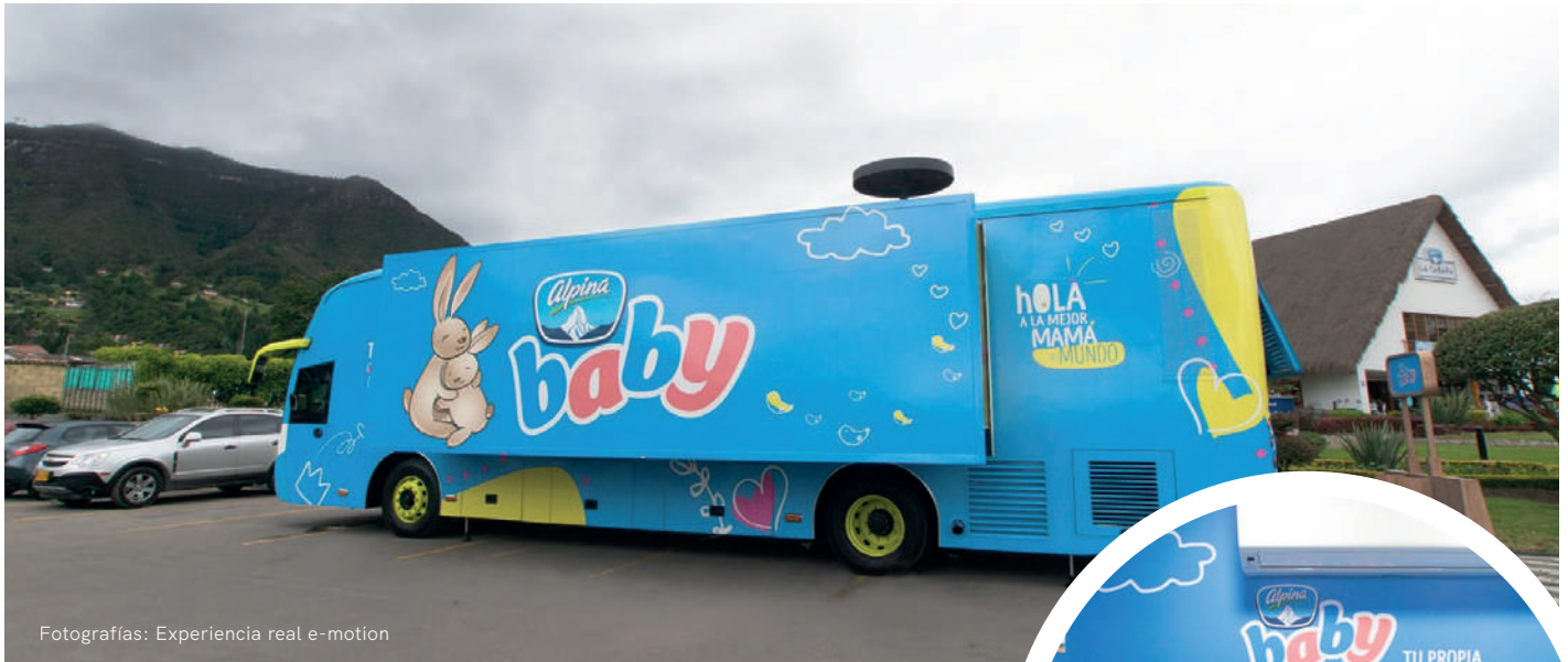
Fotografías: Experiencia real e-motion